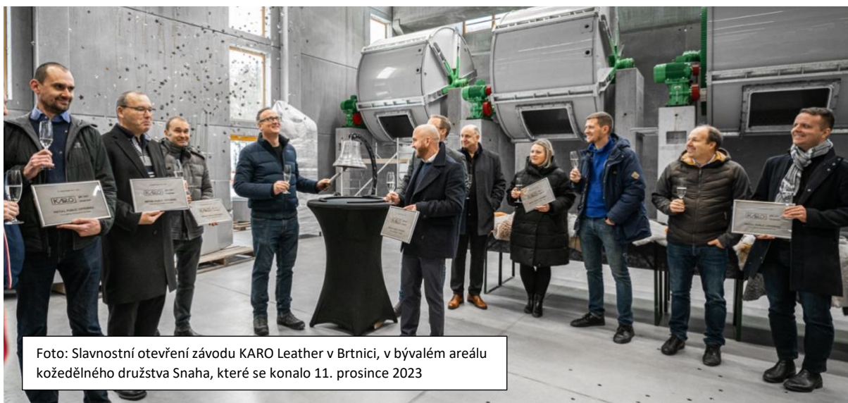
Foto: Slavnostní otevření závodu KARO Leather v Brtnici, v bývalém areálu kožedělného družstva Snaha, které se konalo 11. prosince 2023

KARO Leather a.s., jejíž akcie se obchodují na trhu Start pražské burzy, také dříve oznámila, že do konce roku 2026 chce přejít na hlavní trh pražské burzy. I kvůli tomu KARO nasadilo od letošního roku nový ERP systém v rámci projektu digitalizace, a brzy hodlá díky tomuto kroku adaptovat účetní standardy IFRS.